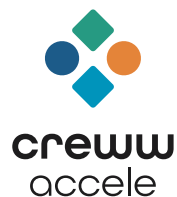
サービスロゴ 3 横組(short)